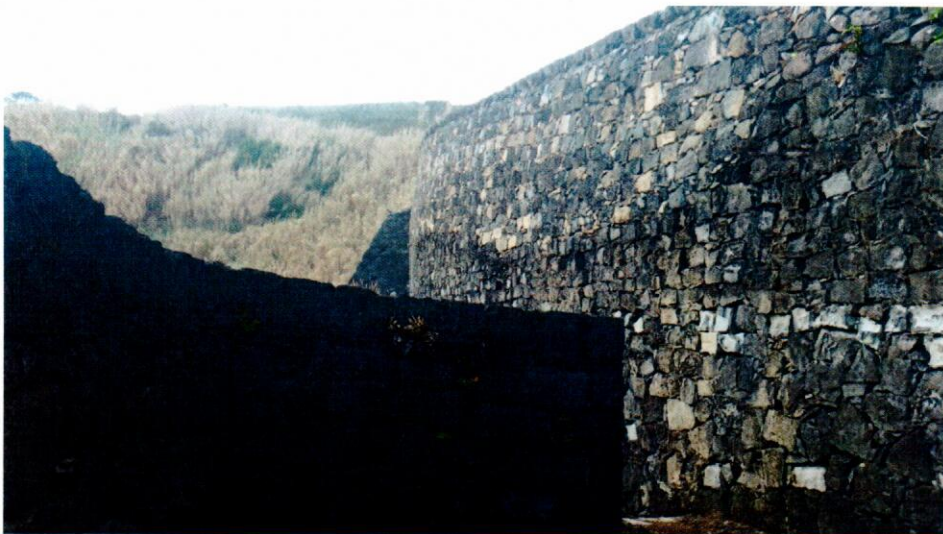
Fotografia 1 – Reconstrução do muro de suporte do Caminho das Pias.