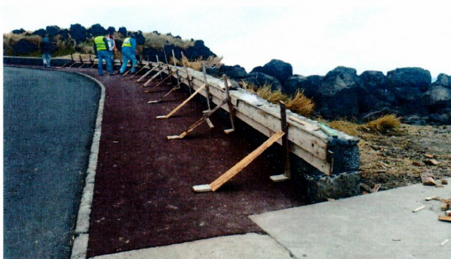
Fotografia 5 – Reconstrução de muro do circuito de manutenção do Sertão.