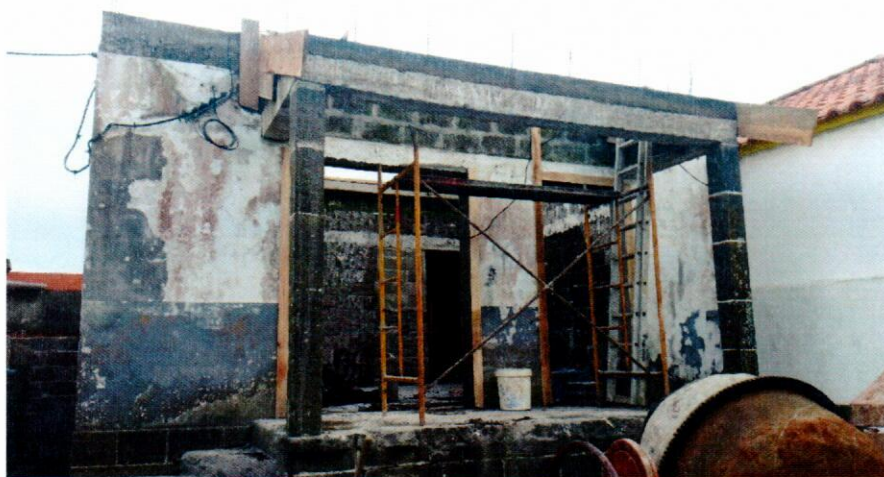
Fotografia 4 – Construção do edifício sede para o Clube de Patinagem.