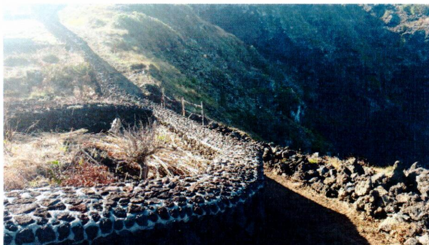
Fotografia 2 – Requalificação do percurso pedestre do Sertão (muros).