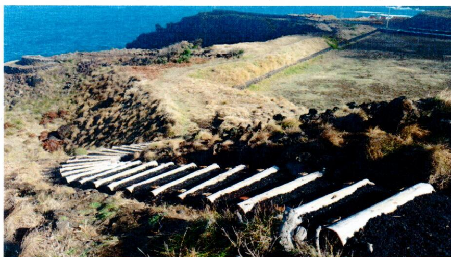
Fotografia 3 – Requalificação do percurso pedestre do Sertão (escadas).