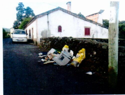
Foto 8 - Recolha de lixo/monstros abandonados.