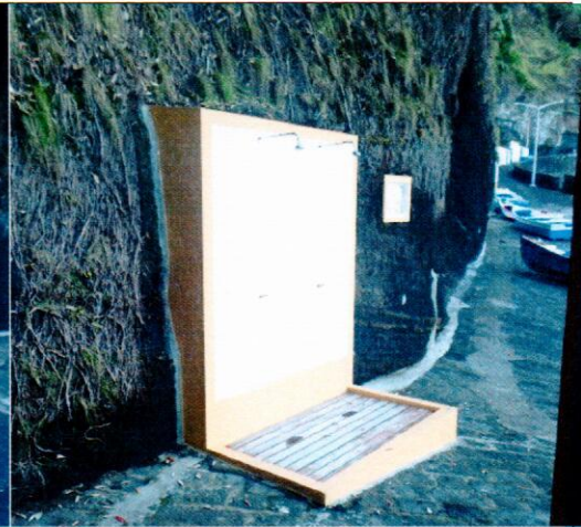
Porto de Pescas