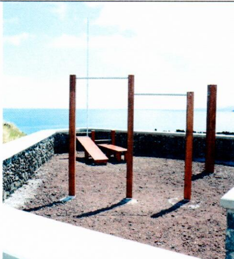
Sertão – Equipamentos de Manutenção