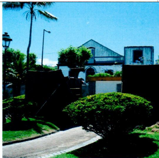
WC Jardim Artur Amorim da Câmara