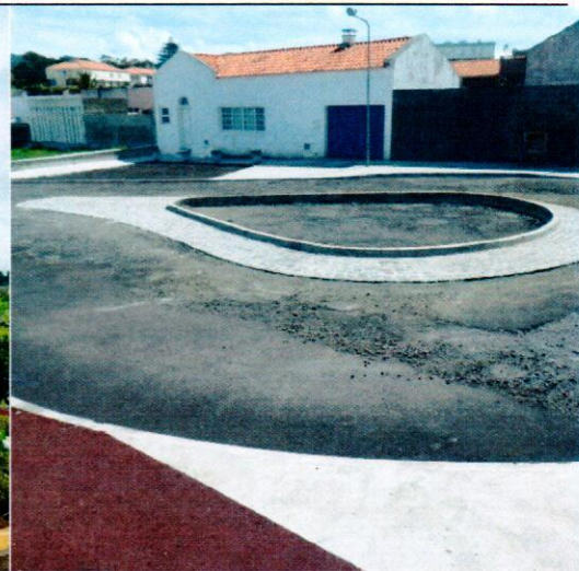
Rotunda da Rua do Sertão