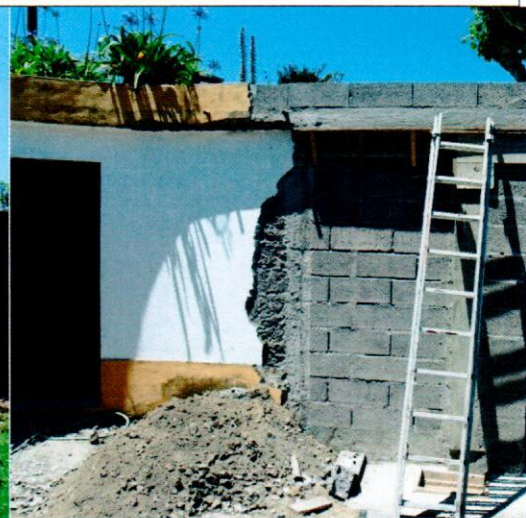
WC Jardim Artur Amorim da Câmara