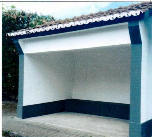
Apeadeiro de autocarros (Dr. H Medeiros)