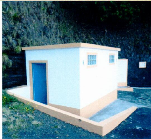
Porto de Pescas