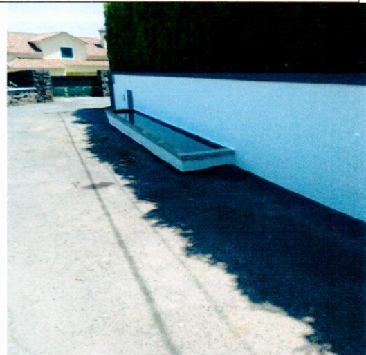
Bebedouro do Marujo