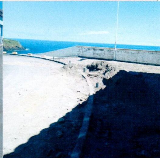
Rua de São Pedro