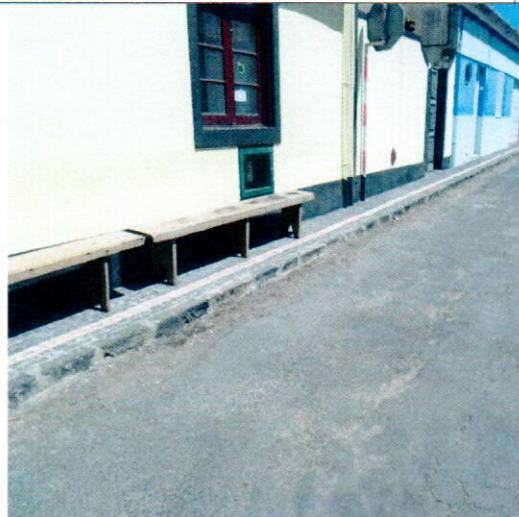
Rua de São Pedro