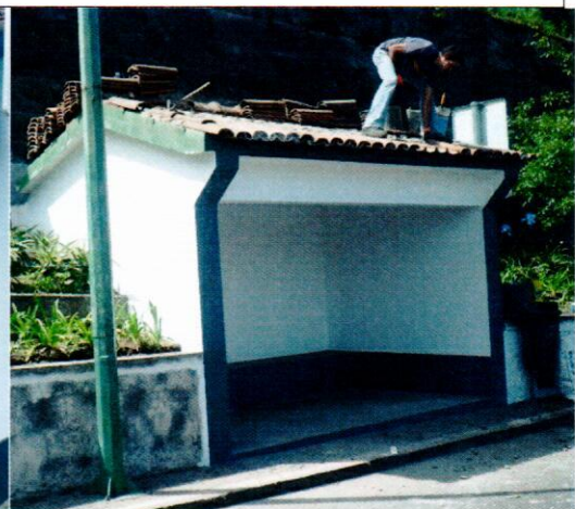
Apeadeiro de autocarros (Infante D. Henrique)