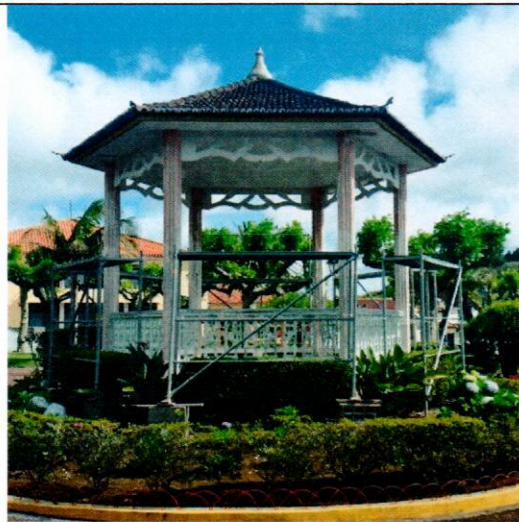
Coreto Jardim Artur Amorim da Câmara